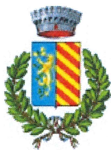
Comune Lugagnano Val d’Arda