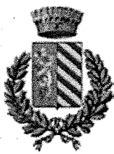
Comune Lugagnano Val d'Arda