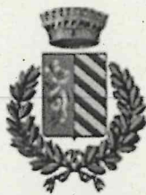
Comune Lugagnano Val d'Arda