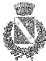
Comune di Morfasso