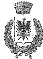
Comune di Vernasca