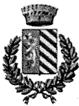
Comune Lugagnano Val d'Arda