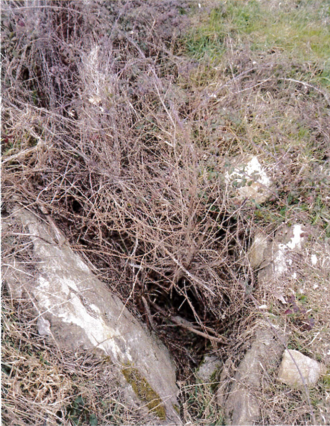
Costa Pozzetto collassato e traversante interrotto.