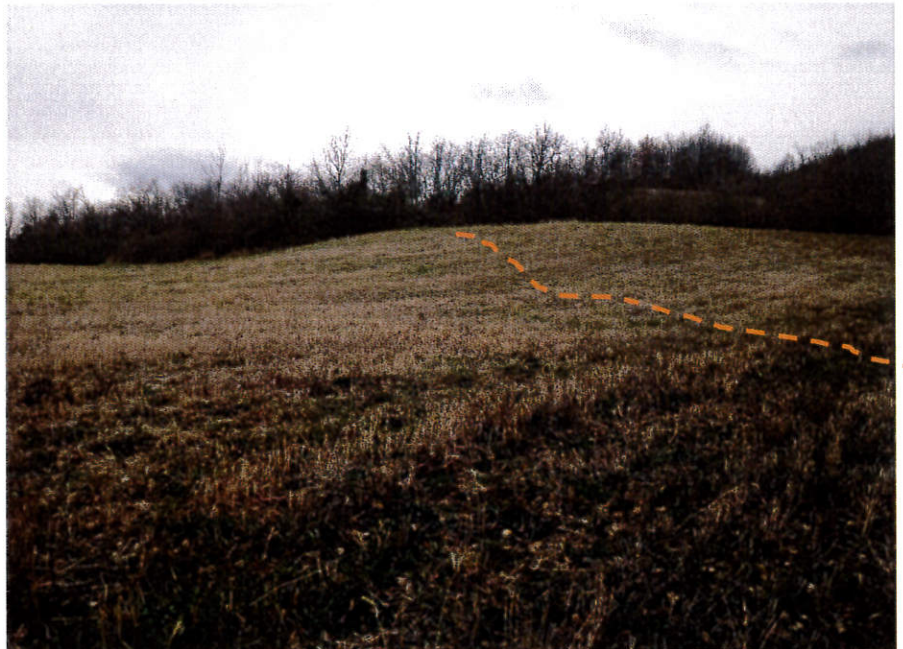
Costa Tracciato del drenaggio di risanamento.