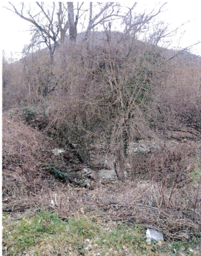
Rio degli Osti: Vegetazione infestante e sezione d'alveo da risagomare