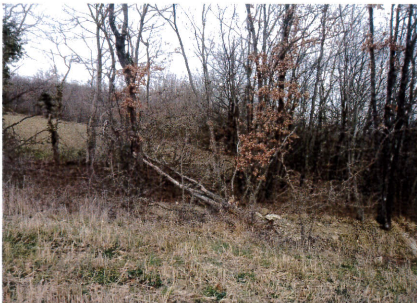
Rio degli Osti: Piante deperienti e schiantate lungo il rio