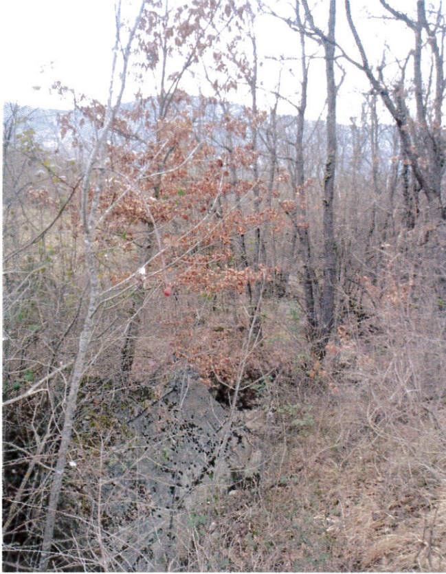
Rio degli Osti: Vegetazione occludente l'alveo e vecchio manufatto