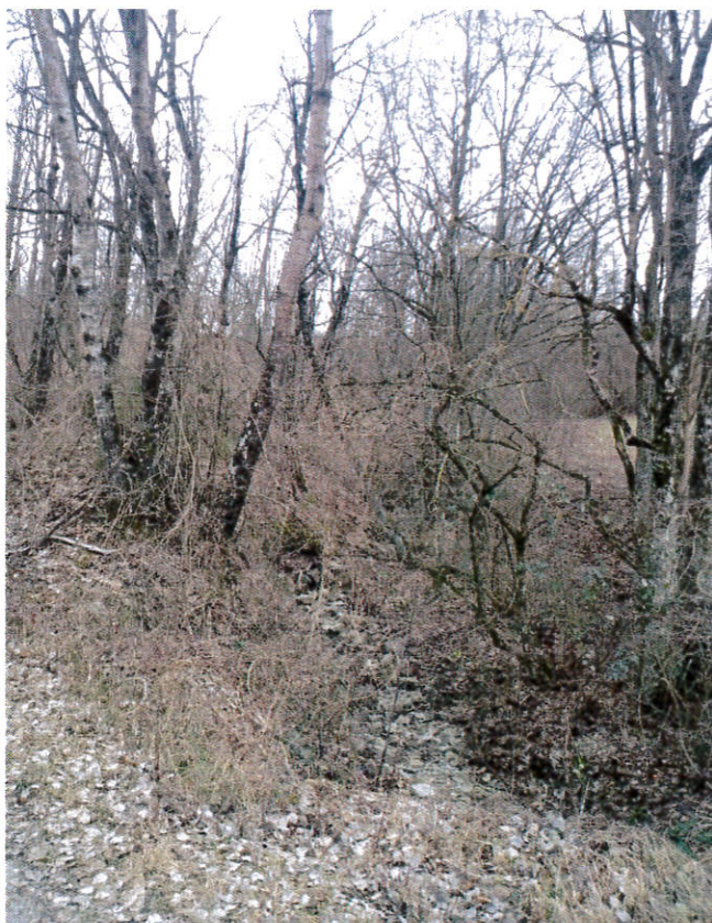
Rio degli Osti: Vegetazione infestante occludente l'alveo