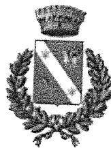
Comune di Morfasso