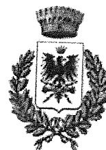
Comune di Vernasca