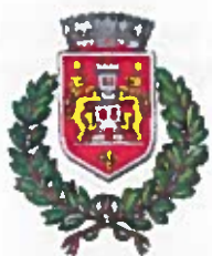
Comune di Castell'Arquato