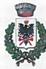
Comune di Vernasca