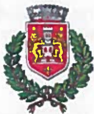
Comune di Castell'Arquato