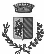
Comune di Lugagnano Val d'Arda