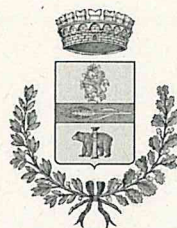
Comune di Morfasso