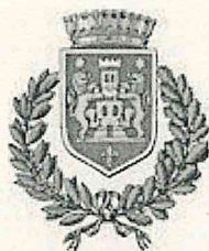
Comune di Castell'Arquato