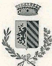
Comune di Lugagnano Val d'Arda