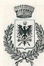
Comune di Vernasca