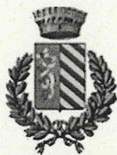
Comune Lugagnano Val d'Arda