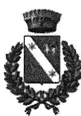
Comune di Morfasso