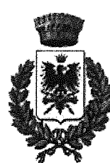
Comune di Vernasca