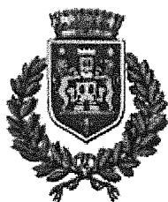
Comune di Castell'Arquato